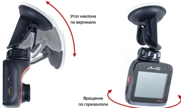
Регулировка положения регистратора Mio MiVue 588

Кому-то нравятся крепления на присоске, кому-то нет. Как говорится, дело вкуса. Сам же я не сторонник двустороннего скотча (зачем пачкать стекло?).