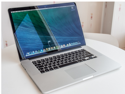
Macbook Pro 15 Retina конца 20013 года

Внешне новый MacBook Pro 15 Retina осени 2013 года ничем не отличается от предшественника. Это вполне характерно для Apple и объяснимо: т.к. дизайн в этой компании берётся не «с потолка», а тщательно разрабатывается на протяжении долгого времени и неудачные варианты нещадно отсеиваются, то действительно — зачем часто его менять?